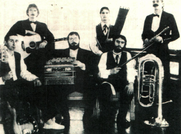
folk talderik onenak Itziarren.

dator txikiteroen Maritxurenganako debozioa. Beste batzuen ustetan, ordea, gaurko festa honen sustraia beste ix-torio batetan oinarritzen da. Urtee-tan zehar besteren kontura ardoak edaten zituen herritar bat ba omen zen Arrasaten, norbaitek basoerdia ordaintzean, ardoa Maritxu dage-neko aldera jaso eta «Por Maritxu» brindisa egiten zuena. Handik sortu omen zen Maritxu txikiteroen zain-dari gisa entronizatzeo ideia. Arrasaten San Joanetan egiten dira herriko festak eta udaldiaren ha-siera denez gero, jendeak kanpora joateko ohitura hartu du. Abuztuan zehar ere, herritar gehienek kanpoan egiten dituzte oporrak eta urriko festa hau bilakatu da herritarrentzat urteko jai nagusia. Bestalde, urteetan zehar Arrasa-teko kale bakoitzak bere festak bu-rtutu ditu. Erdiko kalekoek urte ba-tan Maritxu Kajori eta hurrengoan Portaloiko Amari eskaintzen zizio-ten beren festa eta hor ere aurki dai-teke gaurko festa honen beste su-strairen bat. Egun horretarako gizonezkoak nahiz emakumezkoak traje dotorez jazten dira. «Belle epoque»-eko tan-keran. Horretarako aitona-amonen-gandik jasotako trajeak berriro kon-pondu eta erabiltzeko moduan jarri dituzte asko eta askok. Txikitearen tradizioari jarraiki, arratsaldeko Getan hasiko da festa, ez baitute nahi batzordekoek lanaren ondo-rengo festak duen grazia hori eza-batu nahi. J. AGIRRE