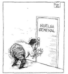
GALLEGO & REY / DIARIO 16