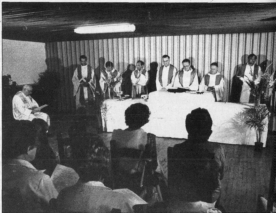
1982ko irailak 26ean, Lartzabalen omenez Miarritzeko Euskal Jailetan egin zen meza.

H iru urte eman zituen Erresistentzian, gerra bukatzean sekulako ohoreak jaso eta «Commandant» izendatu zutelarik