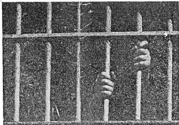
Kaioletatik irten zai

Alde batetik jende eginkorra zigortu eta bestetik erri xumea zer-