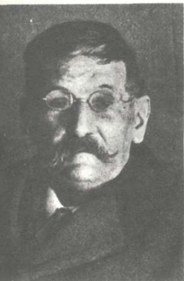
Benito Pérez Galdós