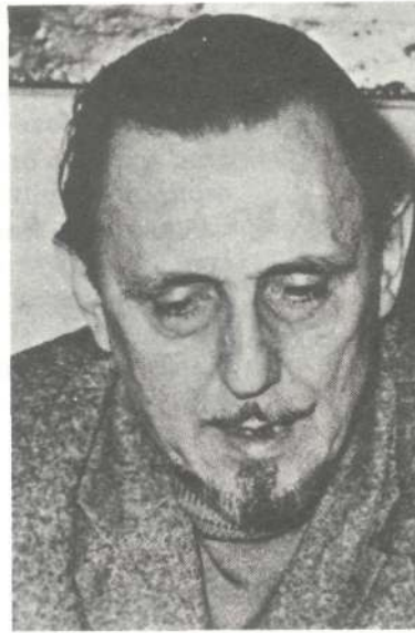
Antonio Buero Vallejo

Teatro de posguerra: José López Rubio ( Celos del aire ), Víctor Ruiz Iriarte ( Un día en la gloria , El landó de seis caballos ), Juan Ignacio Luca de Tena ( Dos mujeres a las nueve , ¿Dónde vas Alfonso XII? ), Edgar Neville ( El baile ), Claudio de la Torre ( Tren de madrugada ), Joaquín Calvo Sotelo ( La muralla ), etc.