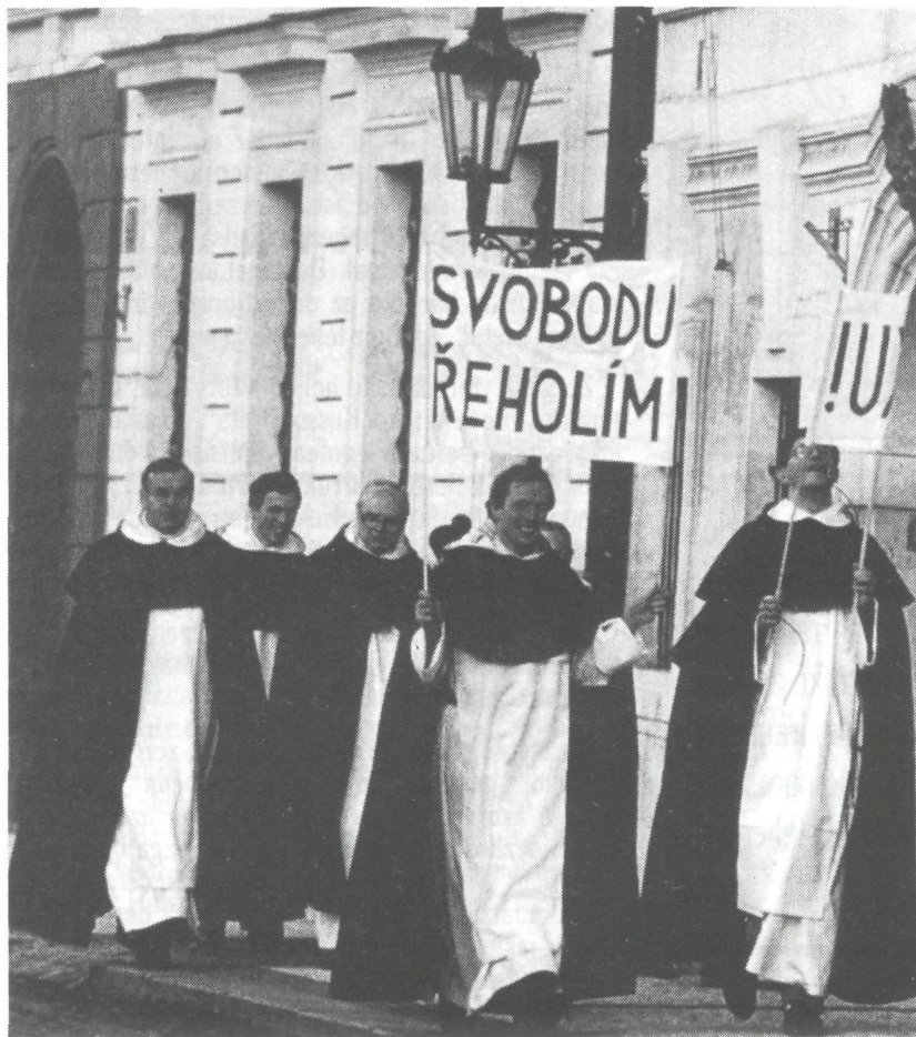
Ofizialki Ekialdeko Europako Estatuak Jainkogabe eta agnostiko izanik ere, dira hizkuntzari datxezkion faktoreak eta erlijioari datxezkionak.

Yugoslavian, esate baterako, eta Bosnia-Hertzegovina Errepublikan bereziki, erlijioaren arauera zehazten dute gehienek beren naziotasuna: «muslim» izan, ala ez izan. Hortxe da berezgunea. Errepublika horretan gehienak hizkuntzaz serbo-kroaziarrak izan arren, «muslim»tzat daukate beren burua askok eta askok. 1981ko Erroldan, zehazki, 1.629.924 serbo-kroaziarrak (hizkuntzaz, alegia), %36,8ek beraz,