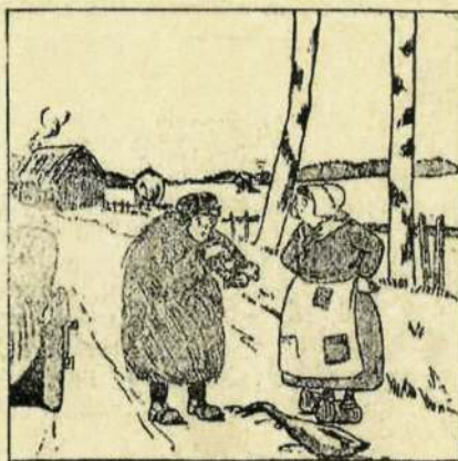
Geure Astakilo ospetsuba, ixontzi-arazuetan sařtu da, ta otoz-otuan aberasturik, tařanta bat erostia otu yako. Eta of dua bitxabaletik ziař, autsa ataraten... eta animali gaxuak ilten.