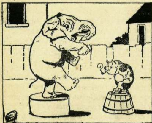
Neu anka baten gañian zufuntzen nok txirikilan.