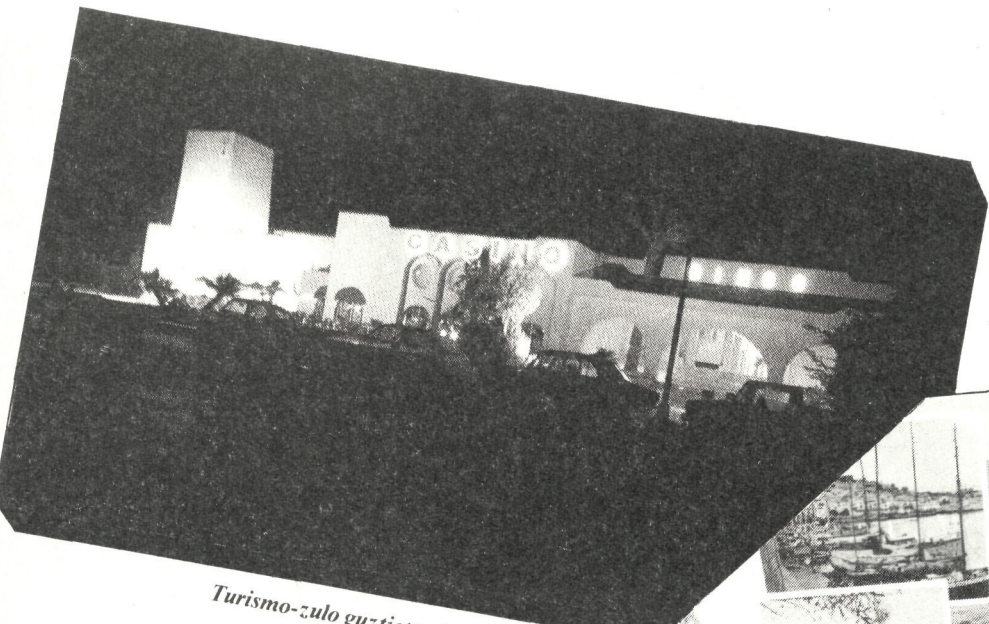
Turismo-zulo guztietan bezala, jokoak nagusi.