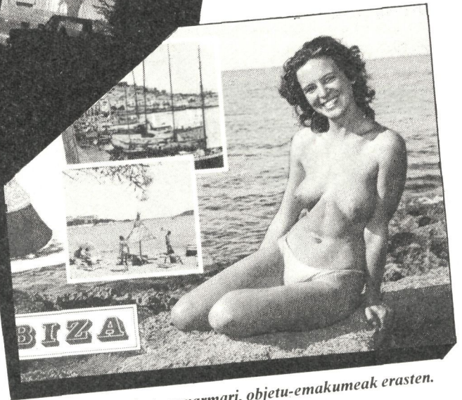
Hondartzen xarmari, objektu-emakumeak erasten.