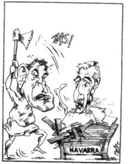
ZULET / EL CORREO ESPAÑOL / 91-VI-10

gehien amorrutzen nauena da, Setien bezalako pertsonek ez uztea sekula pulpitoa hilkor arruntarekin hitzegiteko. Gotzai-egoitzatik jaurtizten ditu hitzaldiak, baina ez dira sekula debate baten disziplinara ezartzen. Haren dialektikak gotzai itxura du beti, deklarazioak informalak izanda ere. Eta elizbarrutiari gidatzeko, zehatzasuna, seriotasuna eta konpromezua exigitu behar litzaioke egiten dituen deklarazioetan. Esate baterako, seriotasiaz gertatutako heriotz guztiak dira izugarriak dudarik gabe, batez ere itzulezinak direlako. Baina zentzu pixkat duen inork ez du esango berdin sentitzen duenik Goardia Zibilari aurre