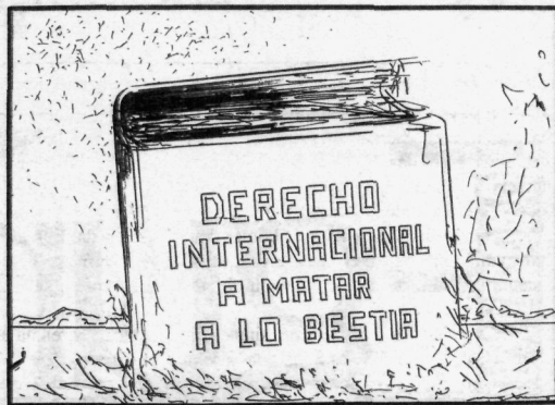
MAXIMO / EL PAIS / 91-1-18