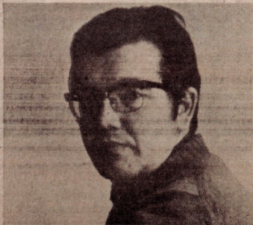
El autor del reportaje estará también presente en Cuixá en el seminario de profundización de los fundamentos de la identidad colectiva.