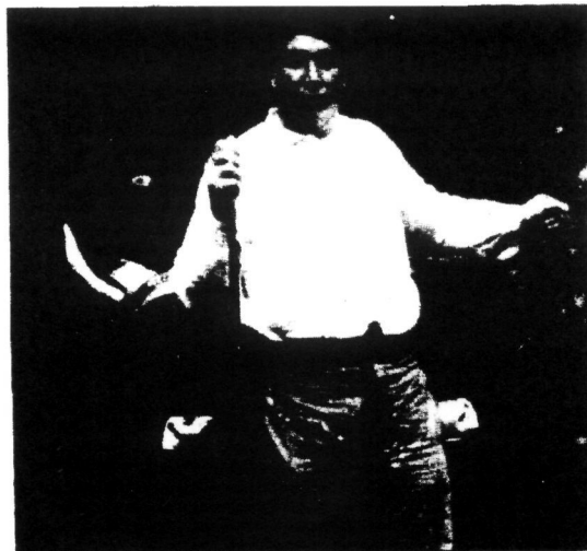
1914. urtean Ibergain cibartarra. Honelakoxeokak ziren hernaniarrak ere.