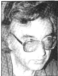
Txillardegizuntzalaría, idazlea eta EHEko partaidea.

Maila honetan, eta bestetan ere, nahaste + elebidunak – proposatzen dituztenak, edo