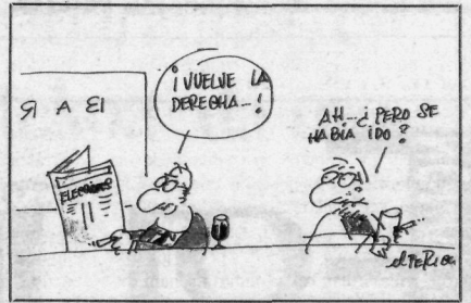
EL PERICH / NAVARRA HOY / 91-VI-1

tonomi Elkarte horretako eta Estatuko segurtasun indarren koordinazio eraginkorra, Segurtasun Batzordearen funtzionamenduz sortutako tirabirengatik ezarria; biktimen ehorz-keta, izan ere, Katalunian jaio edo ez bertan lurperatu bait dituzte, bizi ziren tokian sustrai sendoak zituztela agerian geratu ondoren; azken agurreko zere-monian erabilitako bi hizkuntzak; eta bandera bikoitza, espainola eta Kataluniakoa biktimen hilketzen gainean. Sinboloak eginza bihurtzen direnean, inongo itsukerik ezingo ditu menperatu.