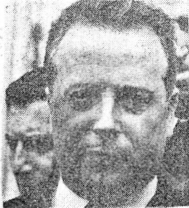
Georges Seguy (C.G.T.)