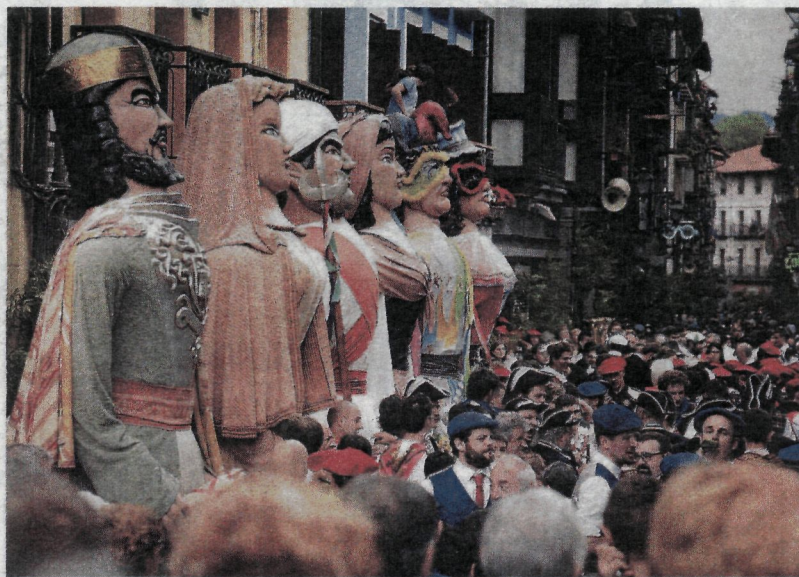
La comparsa viajará en su totalidad; seis gigantes, nueve cabezudos y 35 miembros. de L. ROYO

La invitación llegó hace aproximadamente un año, y el sueño comienza a ser real. «Tamiko Onagi, asesora del festival de Lida, se encontraba en Tolosa y en una de las actuaciones se enamoró de los gigantes. Es una maravilla verlos bailar, y es prácticamente imposible no quedar atrapado», cuenta Idoya Otegui, directora del Topic. La comparsa asistirá a pesar del coste económico que este tránsito supone; además, se ha confirmado una primera parte de la financiación solicitada.