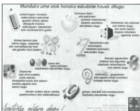
Gazteen eskubideen posterra

-Ez, zuzenki ume edo gazte batek zuzendutako