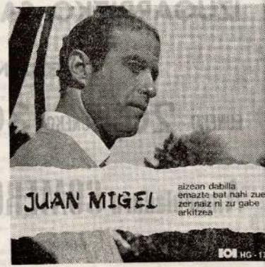
aizean dabillo emazte bat nahi zuen zer naiz ni zu gabe arkitzea