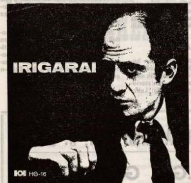
fatzan entzun ahal izari diogulako, hona bere lehen diska, berak sortutako lau kantakin. Ez dio horren belarrieri min egingo ta bai askore-nak gozatuko.