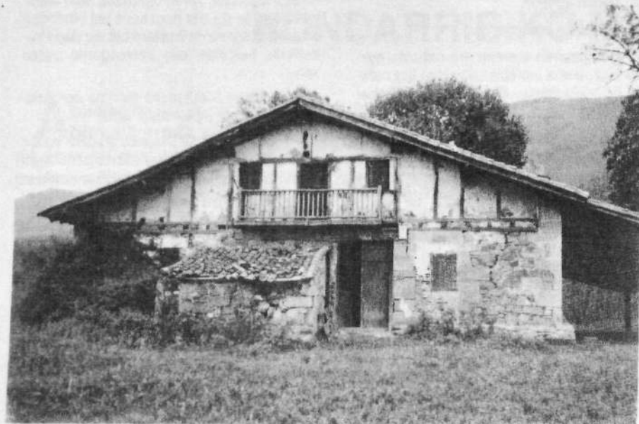
Ipistiku (Epistei). 1965.

Oso ezaguna zaigu Batxillerenea ere, 1787ko zentso hartan Bachillere-nea bezala agertzen zaiguna. Gau egun, zerbait ikasia den guziek dute batxiller titulua, baina hemezortzigarren mendean ez zen normahi.