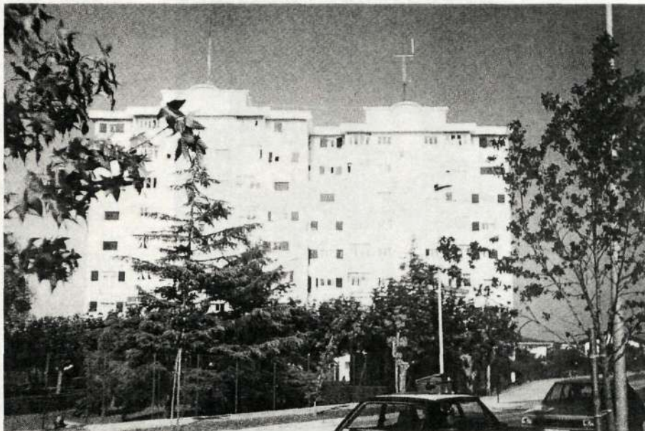
Gaur egungo Bixkundi.