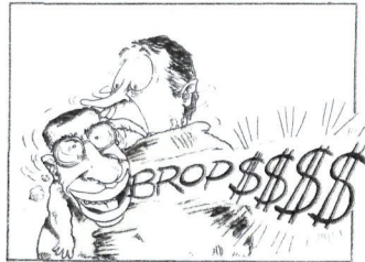
OROZ / DIARIO DE NAVARRA