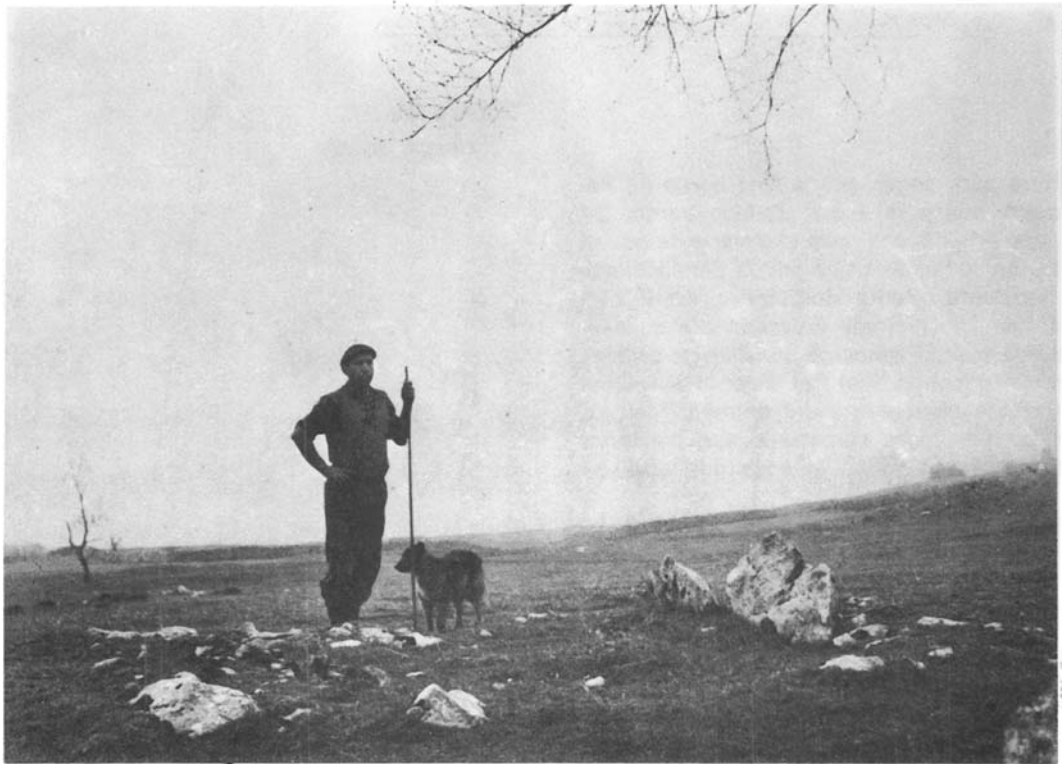
Dolmen de Zain-go ordeka