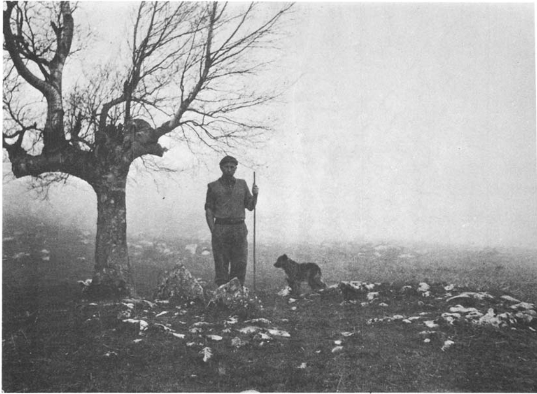
Dolmen de Zain-go ordeka