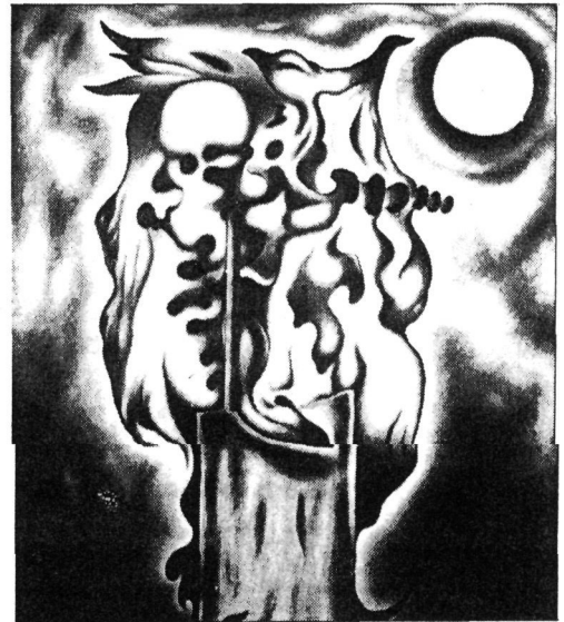
Alfredo Bikondoaren ilustrazioa.

etzen dituen soka, berriz, azter-keta, plangintza, programa eta aurrekontu guztiekin batera, mi-litantzia da. Idealismoa eta mili-tantzia erabat loturik doaz elka-