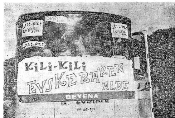
Amabi autobusek eroan eben iragarkia.