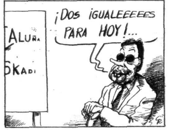
GALLEGO & REY / DIARIO 16 / 91-IX-7

beharko luke Eli Galdosek. Baita galduko duela jakinik ere. Merezki du Hbk bere hitzari eusten dion ala ez jakiteak. Batzar Nagusietan berraztertzea ez da demokratizazioaren kontrako. Manifestaldira joan ginenon gehienok ez ginen A-2 defenditzera joan, demokrazia eta erakundeak defenditzera baizik. A-4aren abantaila guztiak azaldu ondoren Batzar Nagusietako juntero gehienek berriro A-2 aukeratzaren badute, kitto. ETAk eta Hbk ikusiko dute herri hau zer zutolara sartu nahi duten.