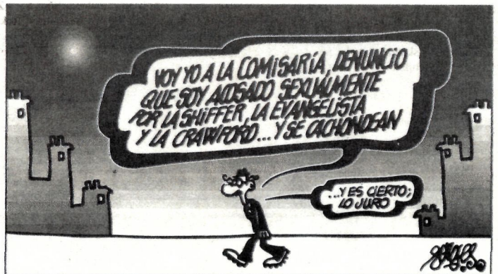
Komisaldegira joan, Shiffer, Evangelista, eta Crawfordek sexu erasoak egiten dizkidatela salatu... eta trufatu... eta egia da: zin dagizuet.