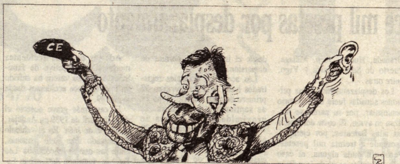
Gallego & Rey en Diario 16, 12-XII-92

En lo que atañe a la instituciones públicas encargadas de la política económica y laboral, también han de comprender que hay zonas, como en Guipúzcoa, donde una medida como la fijación de