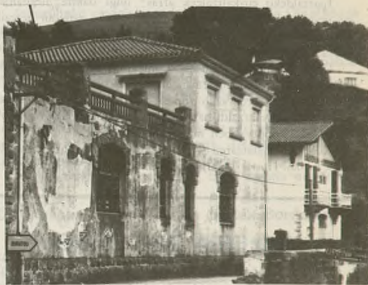
Biriatuko bi etxe, lurrera botako direnak

Biriatu, Bidasoa hibaia loturik dagoen Lapurdiko herri eder xarmantak,* seiehun bat bizilagun eta mila berrehun hek- tarea lur eremu* dituenak, heldu* den abenduko, hogeit bat etxe eta laborantzako bere lurrik hoberenak galduko ditu. Zer- gatik? Itsas hegiko* autobide berria Biriatuko Kurleku deitu* ibarrean gaindi iraganen baita. Orotara, 70 bat pertsonak be- harko du bizilekuz aldatu, orain arteko egoitza maitagarria utziz.