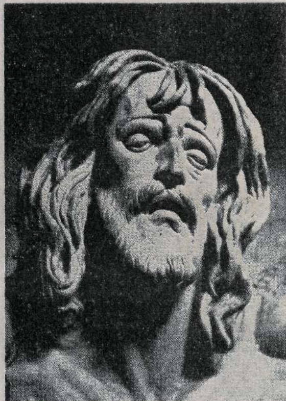
• Kristo bukatu gabea

OLI-UREZKO ERAIKINAK Grupos de accionamiento oico-hidráulicos