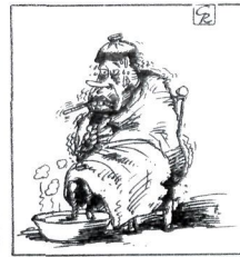
GALLEGO & REY / DIARIO 16

jostailua ihes egiten dien astopetro iraintzaileen moduan azaltzen ari baitira.