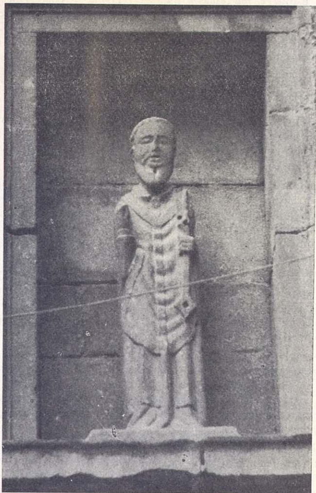
La imagen románica de San Pedro, en la hornacina de la fachada oriental de la parroquia San Andrés Apóstol de Eibar