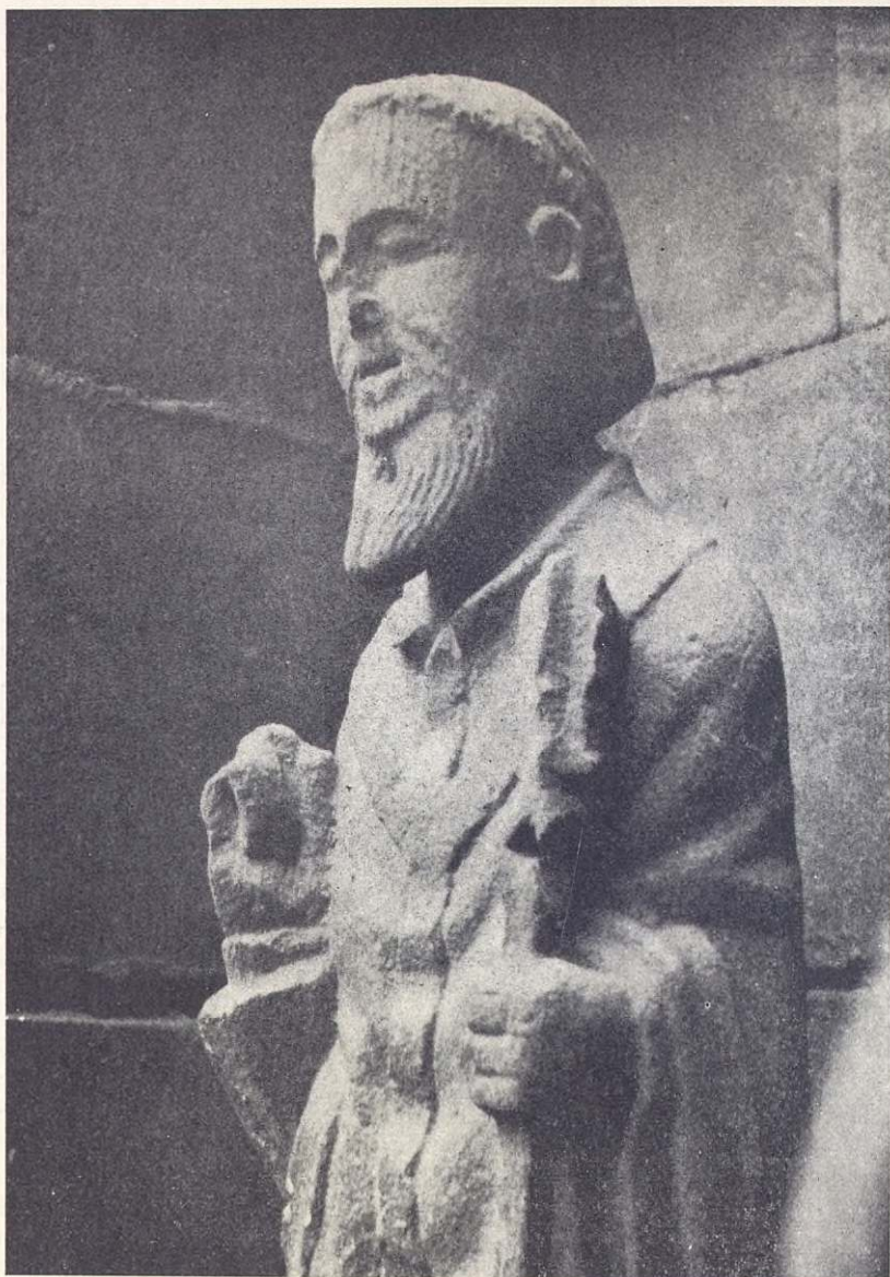
El San Pedro románico de Elbar