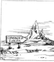
...Ez da ezer gertatzen. BARRABASI