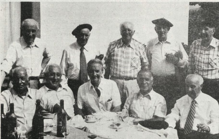
Heriotza-pena izana denok, baina oraindik ere ongi bizirik (Gernika, 1978)