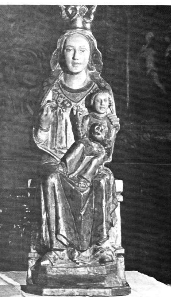
Ntra. Sra. de Uriarte (Elgueta).

A este templo pertenecía la pequeña imagen de Santa Ana, que restaurada se conserva en la parroquia de Santa María de la Asunción de la Villa de Elgueta. Una bella talla de madera policromada, gótico - popular arcaizante, de la primera mitad del s. XIV. Mide 0,75 m. En su estado original de antes de la restauración reproduce una fotografía Lizarralde en su Andra Mari (tomo Guipúzcoa), lámina XLIII, grabado 77.