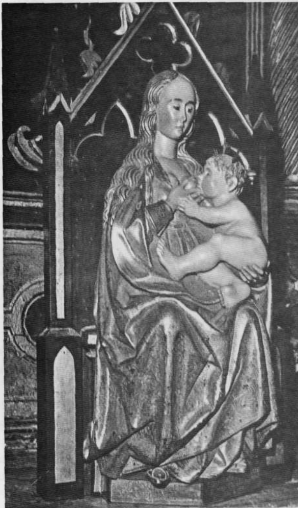
Ntra. Sra. de Elizamendi (Anguiozar).

El lugar, aunque algo descuidado, es encantador. Poco conocido y apenas frecuentado por los montañeros a pesar de su nombre «iglesia en el monte». Del núcleo de Anguiozar dista a unos quince minutos.