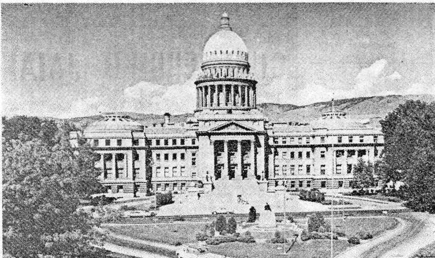
Boise-ko Kapitola, lorategi edereta kattagorri ugariz ingurutua.

ten du. Boise ez da Chicago, Los Angeles edo New York. Boisek 80.000 biztuanle ditu; eta hiri baketsua da. Jendea ez da apartamentuan bizi, kilometrotan barrena sakabanaturik dauden etxetxo eta xaletetan baizik. Ezagutu ditugun euskaldunek etxe ederrak dituzte, askotan bizpahiru kotxe edo, errediza eta apaindura bikainak; eta, hitz batez, ekonomiarik alde-rik, amerikar bizi-maila orosoan bide daude. Honen ondorioak ezagun dira pentsakeran.