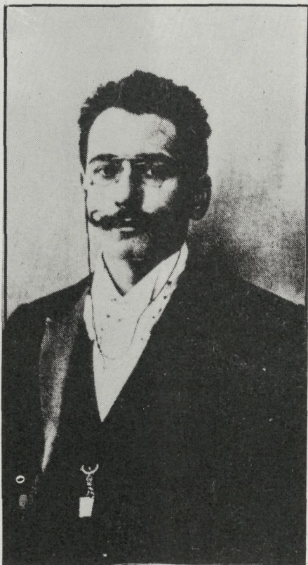
Flandetar Unibertsitatearen aita. artxiboa

Egia esan, horrelako harrigarrikerik ez zegoen asmo horretan: Holandako Unibertsitateak nederlandera ari ziren; eta nederlandera hori flamenkera multzoen «Batua» baizik ez zen. Baina bertako eskuindarrek, guztiz ultra-va-