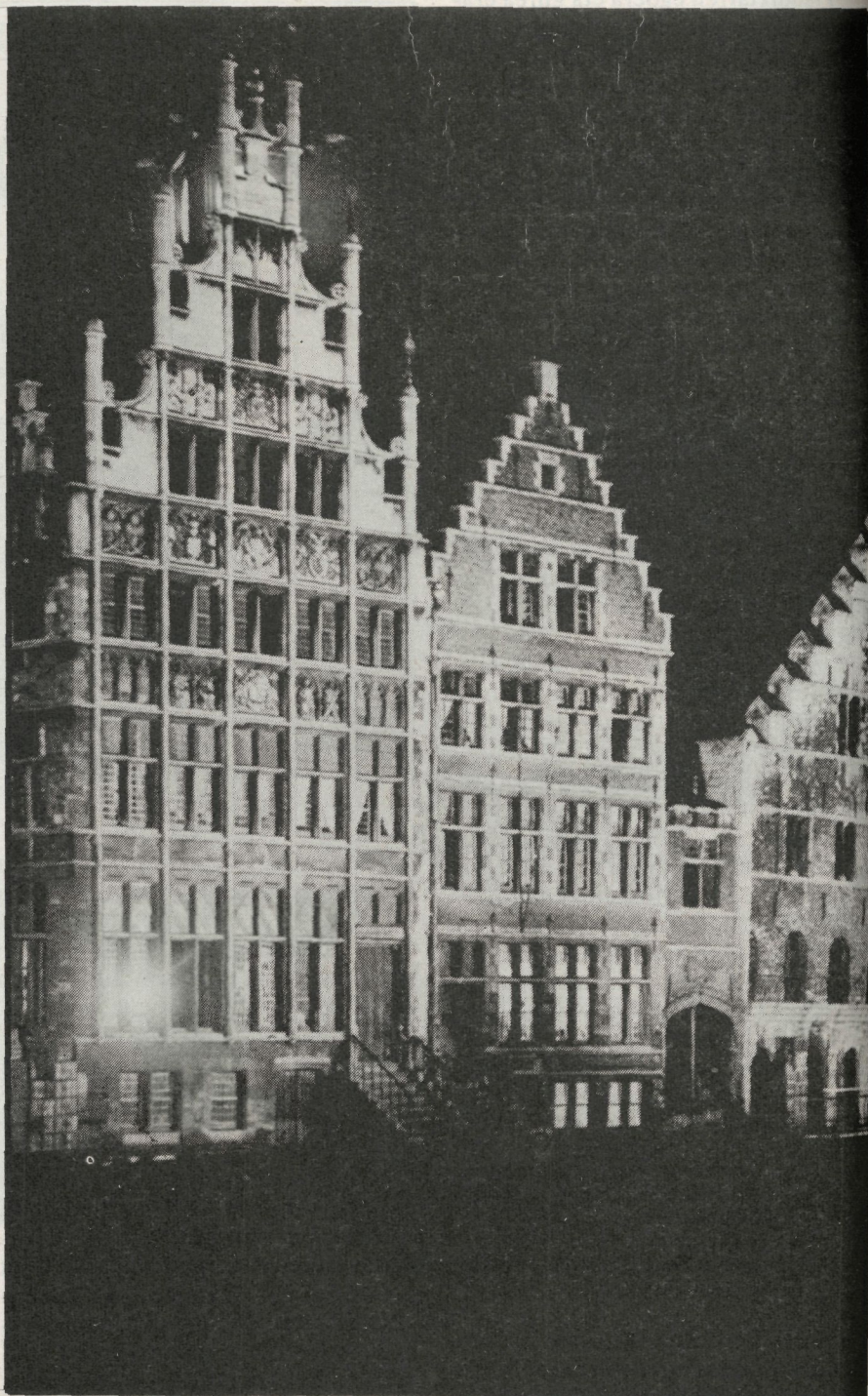
Gent, flandretar abertzaletasunaren sorterrria.

Eta 1930-an, irakats-hizkuntza bakartzat nederlandera onarturik, Gent-eko flandretar Unibertsitatea zabaldu zen. 1935-an gai teknikoetan ere frantsesa abandonatu zen. Partida irabazita zegoen. Borrokak 46 urte eramane zituen.