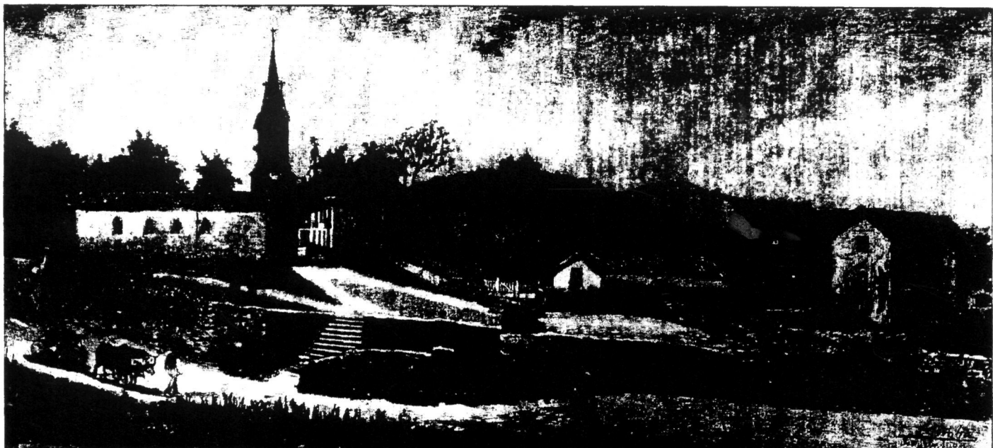
Antiguako eliza zaharra. Miramar jauregia dagoen lekuan, eta bere kanpandorra erantsia duenez, 1880 inguruan egin zuen marrazkia Comba-k. Ondo-ondoan, fotoan eskuin alderaxeago, "Bikariyo-Etxea" ageri da, Aita Aristizabal "jaitsi" baino lehenago bizi izan zen berbera. Atzeko tontorrean "Lugaritz" ageri da, garai hartan granja eredu izandako. Eta eskuin aldean, aldapan beheerako haseran, "Martaene" baserria.

Antigua auzoak beti izan du halako herri-fama. Antigutarrok ba omen dugu (antigutar zaharrok bederen), eta beste desberdintasun guztien gainetik, herrikidetasun harrigarri hori. Eta, alde honetatik, nik antigutar osotzat hartzen dut neure burua. Hots, beste