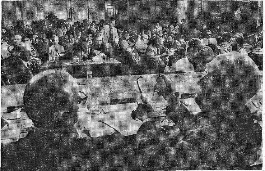
«...gainerontzeko mundu guztiak hoin nahlaeren obedientzi barruan ibili beharko du hemendik aurrera...»

Euskal herri-mugimendua krisi batetan erori dela, edo bata dugula, dirudi. Eta Europan eta Amerikan ere, ezker berria orientazioa galdurik, nora gabe, estrategia berriren bat bururatu beharrean, aurkitzen da.