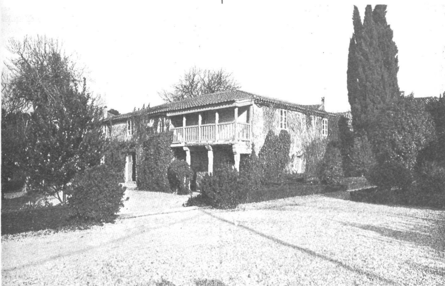
El "pazo" donde nació y vivió Rosalía de Castro

a risoña esperanza; do que a vivir comesa sempre é amiga; só enemiga mortal de quen acaba...!