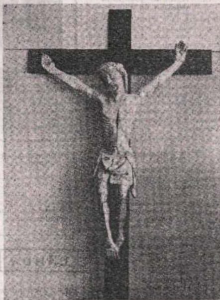
Asligarribia'ko Kristo au galdutzei eman genezake

probintziako auzoetan eleiak ikusten ta zenbait erromaniko agiri billatuak dirut. Ta, ontaz jardunaz gauza batek nau, sa-