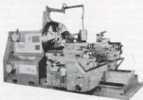
Torno frontal "DYE" Modelo T. F. 85