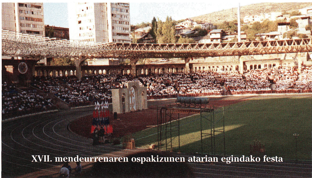
XVII. mendeurrenaren ospakizunen atarian egindako festa

Horren ondorioz, Eliza Apostolutarraren Liturgian grekoa eta siriera albora utzi eta hizkuntza nazionala nagusitu zen berehala; Administrazioan ere, iraniera eta arameera baztertu, eta armeniera ezarri zen; kulturean, berriz, literatura kristaua eta unibertsala armenierara itzuli ziren, obra originalak ere idazten ziren bitartean.