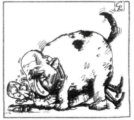
GALLEGO & REY / DIARIO 16

hala nola ikerketa judizial hutsaren gaitetik ikerketa fiskalari eta polizialeari lehentasuna ematen dien sistema horretan.