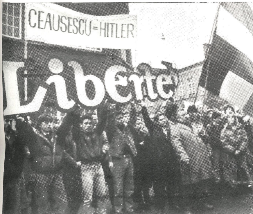
Errumaniak magyartarren kontra buruturiko politika gaitzesten du Bruselasen atzerritaruriko hungariar talde honek.

Magyartar asko, esana dugunez, herri txikitan bizi da: 500/1.000 biztanle. Hots, 1973ko legeak ('barneko araudiek' ofizialki) hauxe agindu du: hungariar eskola bat zabaltzeko, 25 magyartar haur behar direla gutxienez. Herri askotan, beraz, demografi arrazoiengatik, kopuru hori iritsi ezin, eta errumaniaraz eskolatu behar. Errumaniar eskolen zabalketa, noski, beti baita legez-