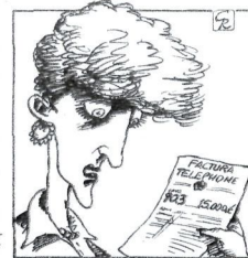
GALLEGO & REY / DIARIO 16

ziazio bat hasi, hauteskondeei begira Euskal Herriko baketze prozesuan «arrakasta» lortu duelako argudioa erabiltzeko. Hauteskondeei begirako manobra bategatik ezin da arriskuan jarri Estatuaren duintasuna.