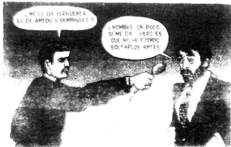
- Ez dizu lotsarik ematen Amedo eta Dominguezak? - Tira. Pixka bat bai. Izan ere, ezin izan ditut lehenago askatu. LOPEZ & PEREZ / EGIN

Euskal nazionalismoak indarra eta heldutasuna erakutsi lortu zuenean bai eskuneko bai ezkerreko izateko nazionalisten eskubidea aldarrikatzen zuten ezkerreko alternatiba bat planteatzea, euskal ezker nazionalaren adierazpide hori lehenengo autonomismorantz lerratu zen eta, azkenik, bat egin zuen sozialismo estalarekin. Gehiago ere badago: Euskadiko Ezkerra hartan bategitearen aurka azaldu zen zatiak egun, duten boz koalifikatuenetako baten ahotik, nazionalismo demokratikoa alderdi bat