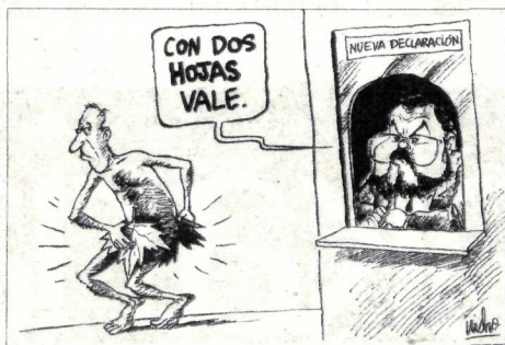
Aitorpen berria. —Bi orriekin nahikoa da.