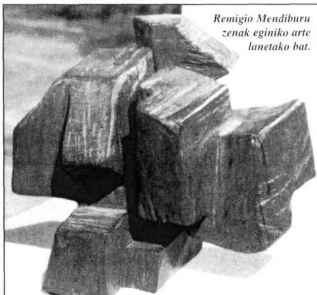
Remigio Mendiburu zenak eginiko arte lanetako bat.

Bere dibujoen irudiak eta margogintzatik hasi eta aski dugu 1958-1959garren urteetan eskulturaz egin zituen irudietatik hasiz eta ondoko urteetan jarraitu zuen bidea nondik nora eraman zuen jakiteko: