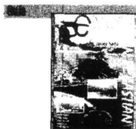
J. Sada y L.M. Jz de Aberasturi Donostia, San Sebastián Ed. Txerto • 214 páginas

América en gestación. El artesano sueña con irse a América y se va allí, con su hijo de once años y con el acordeón. Luego, será el acordeón el que adquirirá el protagonismo y con él el lector visitará distintas comunidades de este Nuevo Mundo, yendo de Iowa a Texas y de Maine a Louisiana, pasando de mano en mano por descendientes de africanos, polacos, noruegos, irlandeses, franco—canadienses y vascos, variedad de razas y gentes que nos irán mostrándose al sonido de este viejo acordeón en una novela que resulta movida e interesante