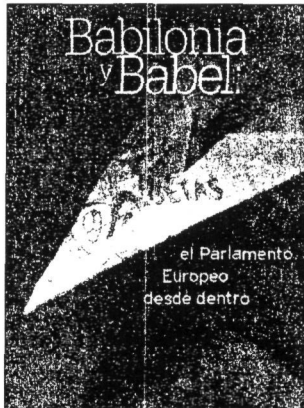
el Parlamento Europeo desde dentro cibir dietas por días que en realidad no han trabajado. El Parlamento europeo destina 33 000 millones de pesetas a alquileres,

Además, en numerosas ocasiones hacen uso de la picaresca para cobrar kilometrajes no realizados, conseguir billetes de avión para viajes que no van a llevar a cabo o per-