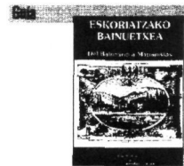
J.M. Urkia / Txartyn de Bazterbero taldea Eskoriatzako Banuetxea 122 páginas

esta ocasión acompañada por el escritor y editor L. M. Jiménez de Aberasturi, que se encarga de poner en nuestro conocimiento lo que sobre gastronomía puede encontrarse en esta ciudad: así como sobre el Aquarium. En lo que al conjunto de la obra se refiere, se encontrará aquí todo tipo de informaciones, tanto sobre rincones naturales como sobre clima, historia, sus facetas de San Sebastián como ciudad turística, y una visita amena a tantos lugares donostiarros, incluyendo los Baños y montes perifericos. Contiene muy buenas ilustraciones.