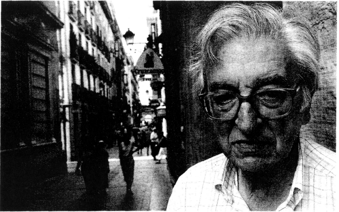
(J.M. COETZEE)