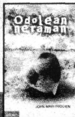
Joan Mari Irigoien