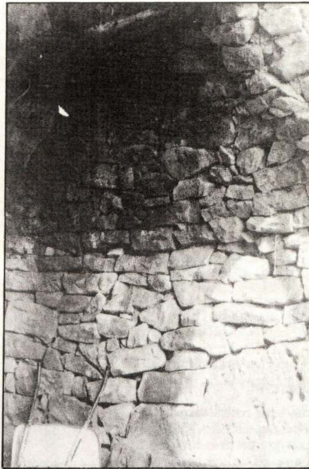
Leiurieta, Harpeko horma

Leiurieta, orain laburturik Leuta bezala ezagutzen da. Aldiz, Leizanabar, laburpenez zein al d a k u n t z e z gutxienez zortzi eratara jasoa dut. Gehienetan antz